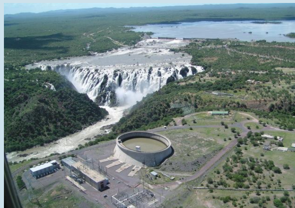
Gewaltig: Die Ruacana-Wasserfälle.

KfW Bankengruppe Geschäftsbereich KfW Entwicklungsbank Kompetenzcenter Klima und Energie Palmengartenstraße 5-9 60325 Frankfurt Telefon +49 69 7431-8706 Martina.Stamm@kfw.de