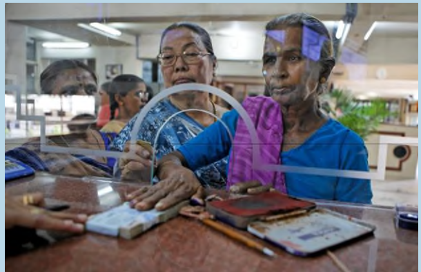
An diesem Schalter in Indien werden Frauen bevorzugt bedient.

Die KfW Entwicklungsbank fördert Vorgaben zur Gleichberechtigung der Geschlechter in vielen Regionen und Bereichen. Ein großer Teil der Projekte befindet sich in Subsahara-Afrika, Asien und in der MENA-Region. Während viele Vorhaben zur Förderung der Gleichberechtigung im Bereich Gesundheit, Bildung, und Nachhaltige Wirtschaftsentwicklung zu finden sind, gibt es darüber hinaus unter anderem auch Projekt in den Bereichen Wasser, Energie und Landwirtschaft.