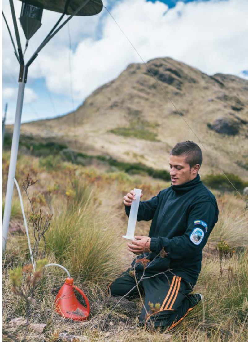
Измерение влажности в Национальном парке Гуанента, Колумбия

Банк развития KfW привлекает средства через рынок капиталов, а также непосредственно через частных инвесторов.