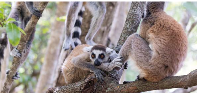
Кошачьи лемуры в Национальном парке Исало, Мадагаскар

Мы, как и наши партнеры, ответственны за успех политики развития. Партнеры на местах отвечают за подготовку и реализацию инициатив. Для размещения заказов и подрядов они проводят открытые тендеры на предоставление консультаций, выполнение поставок и оказание услуг и заключают договоры после их проверки в KfW. При проверке документации мы следим за тем, чтобы размещение подрядов и заказов проходило справедливо и прозрачно, в соответствии с правилами, признанными на международном уровне. Нормативные документы по размещению заказов и подрядов находятся в открытом доступе. Во всех проектах, которым мы оказываем содействие, мы стремимся к тому, чтобы все участники соблюдали самые строгие требования в сфере социальных обязательств, борьбы с коррупцией, защиты климата и окружающей среды.