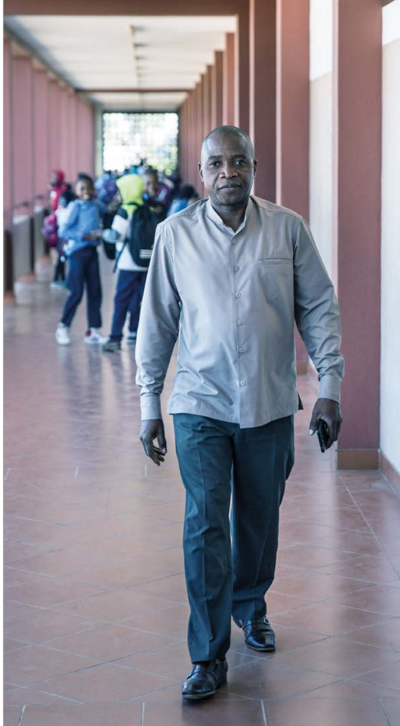
Начальная школа в Мапуту, Мозамбик

Электронная новостная рассылка «KfW Research: политика помощи развивающимся странам» будет регулярно информировать вас о сотрудничестве в области экономического развития на немецком и английском языках. Подписаться на рассылку можно по адресу: www.kfw-entwicklungsbank.de