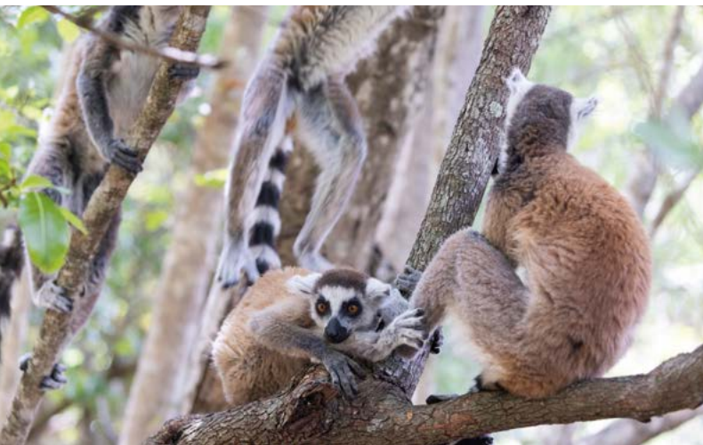
Madagascar, Katta lemurs no Parque Nacional de Isalo

Assumimos a responsabilidade conjunta pelo sucesso da política de desenvolvimento. Os parceiros locais são responsáveis pela preparação e implementação dos projetos. Eles colocam os contratos de consultoria, fornecimento e serviços em concurso público e celebram os contratos correspondentes, após a verificação por parte do KfW. Quando examinamos os documentos, asseguramos que o concurso e a adjudicação de contratos sejam justos e transparentes e sigam regras reconhecidas internacionalmente. As diretrizes de compras são públicas. Em todos os nossos projetos que apoiamos, é importante que todas as partes envolvidas cumpram os altos padrões internacionais em relação aos aspectos sociais, combate à corrupção, proteção climática e ambiental.