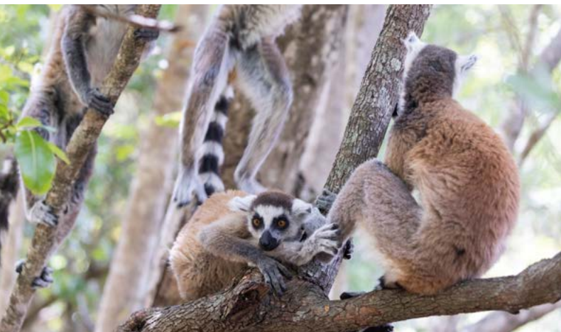
Madagascar, lémuriens Katta au parc national de l'Isalo

Le taux de réussite est élevé : près de 80 % des projets financés par la KfW Banque de Développement sont considérés comme des succès par le département d'évaluation.