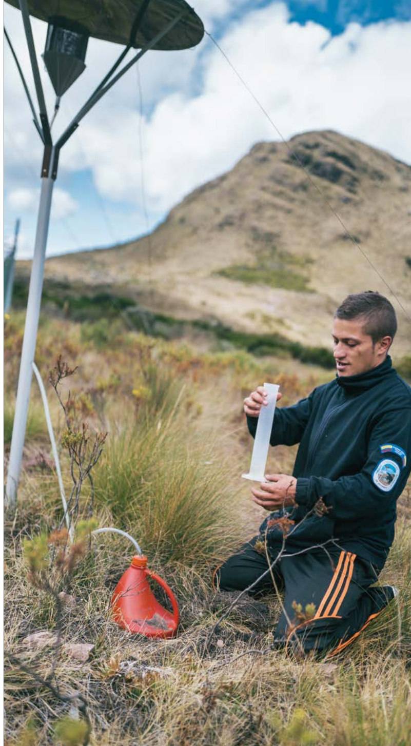
Colombie, mesure de l'humidité au parc national de Guanentá

La KfW mobilise des fonds sur le marché des capitaux et de plus en plus directement auprès d'investisseurs privés. Dans les structures des fonds, les fonds publics constituent des investissements de base et une couverture pour les investisseurs privés. En 2021, nous avons investi dans 30 fonds à impact (Impact Fonds, IF) nouveaux et existants pour un volume d'environ 575 millions d'euros pour le compte du gouvernement fédéral et de l'UE. Au total, la KfW a ainsi investi dans 80 fonds pour plus de 4 milliards d'euros.