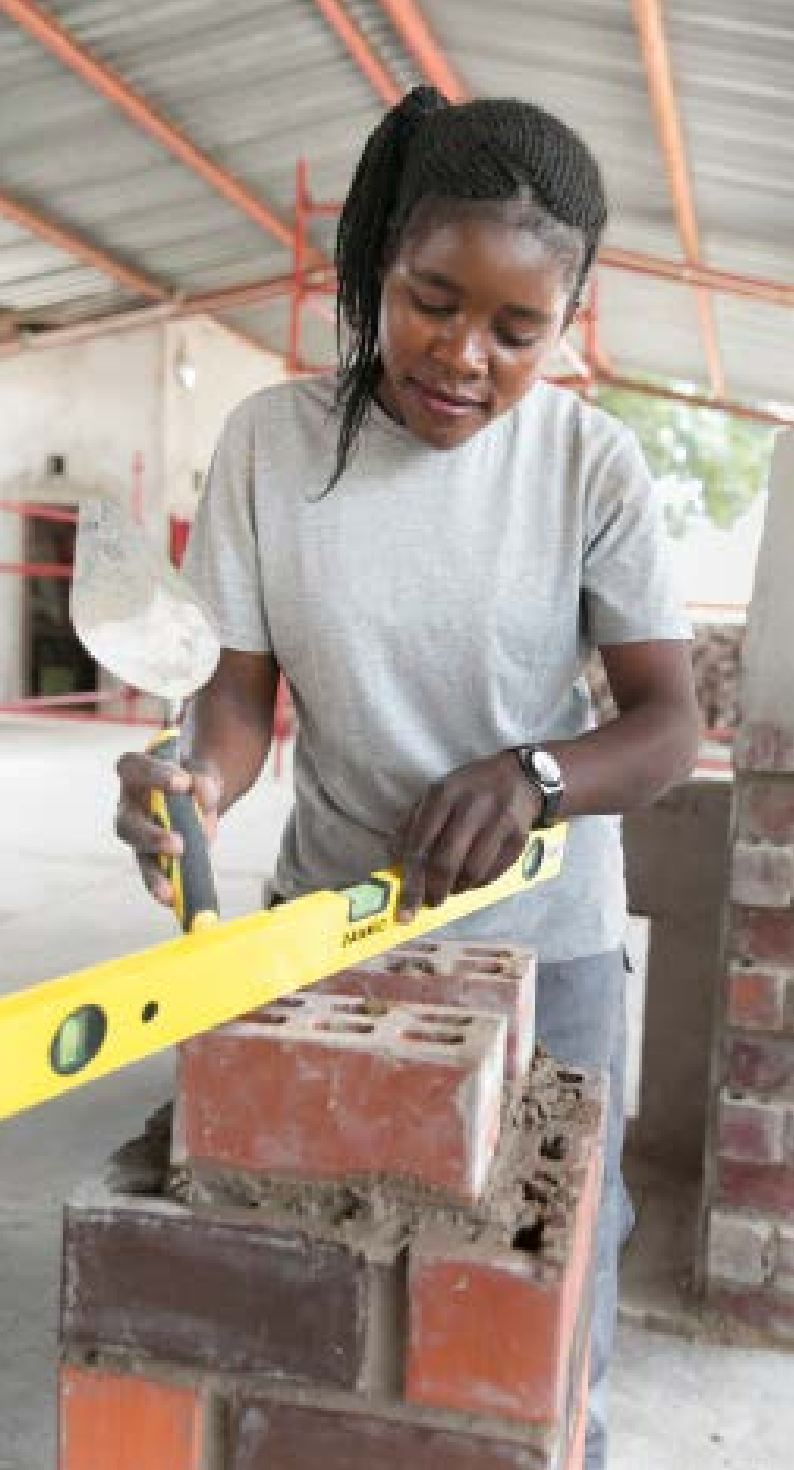
Treino vocacional na Zâmbia