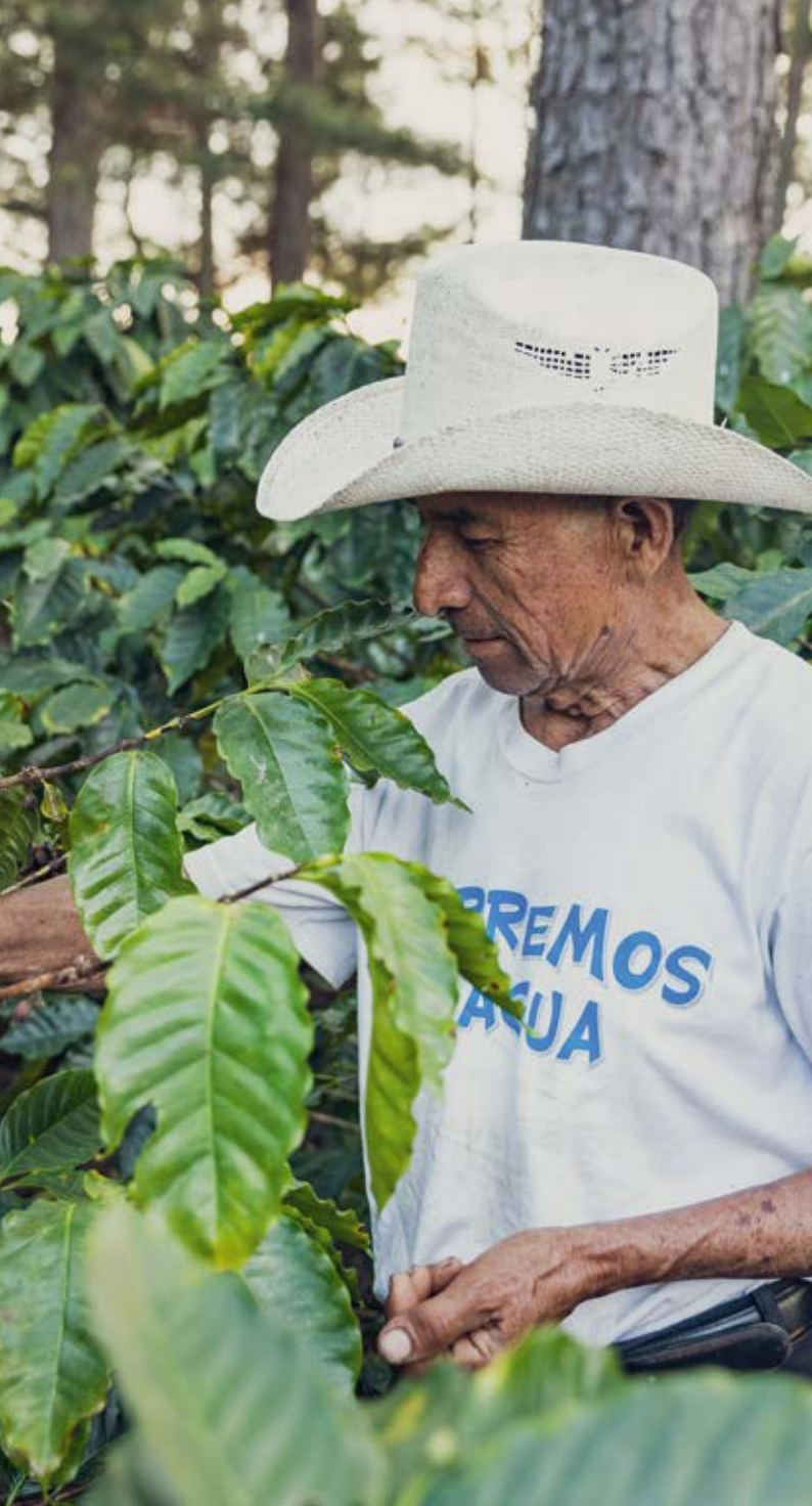
Produtor de café na Guatemala