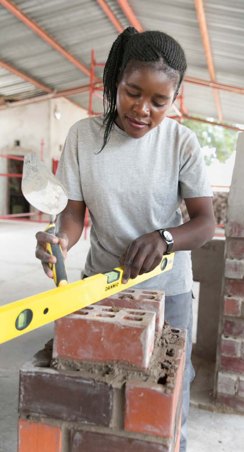
Treinamento vocacional na Zâmbia