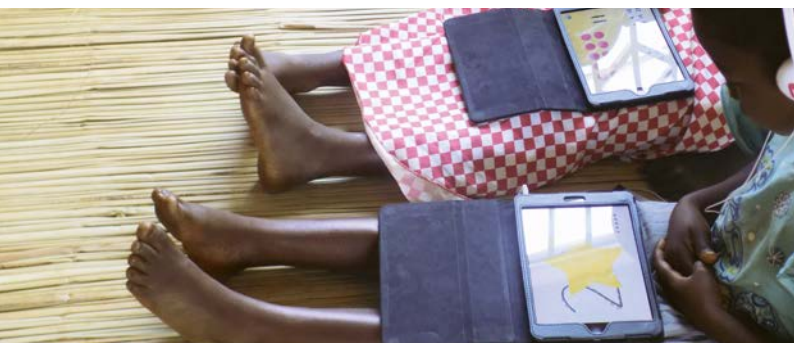
Au Malawi, des enfants d'écoles primaires reçoivent des leçons supplémentaires sur des tablettes.

Dans le cadre de l'Initiative spéciale Formation et Emploi du BMZ, la KfW a créé en novembre 2019 la facilité « Investissements pour l'emploi ». En décembre 2019, les premiers fonds du BMZ ont été versés pour un montant de près de 98 millions d'euros, et l'objectif est de parvenir à 400 millions d'euros. Dans les six pays partenaires de réforme du BMZ, ainsi qu'au Rwanda et en Égypte (en projet), des investissements créateurs d'emplois sont ainsi financés par le biais de concours. Jusqu'à 100 000 emplois et 30 000 places de formation doivent être globalement créés dans le cadre de cette initiative spéciale.