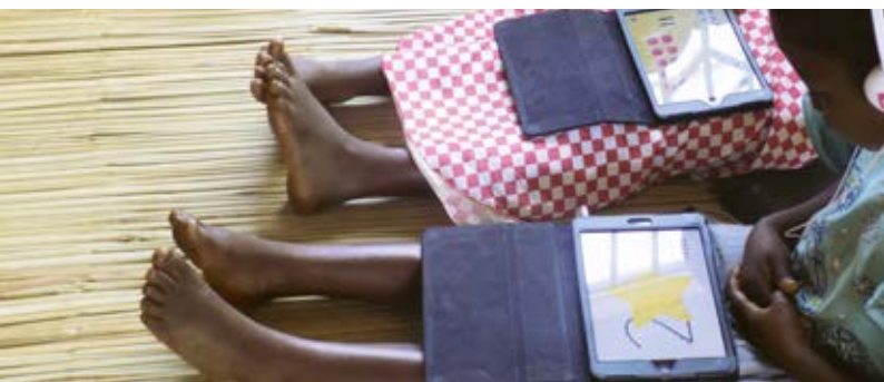
Au Malawi, des enfants d'écoles primaires reçoivent des leçons supplémentaires sur des tablettes.

Dans le cadre de l'Initiative spéciale Formation et Emploi du BMZ, la KfW a créé en novembre 2019 la facilité « Investissements pour l'emploi ». En décembre 2019, les premiers fonds du BMZ ont été versés pour un montant de près de 98 millions d'euros, et l'objectif est de parvenir à 400 millions d'euros. Dans les six pays partenaires de réforme du BMZ, ainsi qu'au Rwanda et en Égypte (en projet), des investissements créateurs d'emplois sont ainsi financés par le biais de concours. Jusqu'à 100 000 emplois et 30 000 places de formation doivent être globalement créés dans le cadre de cette initiative spéciale.