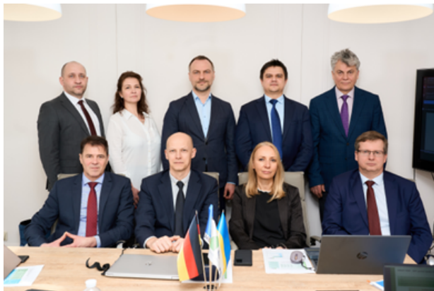
Das Gruppenfoto zeigt die Mitglieder des 5-köpfigen Aufsichtsrates (vorne, hier 4 von 5 Mitgliedern) sowie des Verwaltungsrates der NDI (hintere Reihe).

Heute arbeitet die NDI mit 52 Finanzinstitutionen zusammen. So haben Unternehmen Zugang zu verschiedenen Finanzprodukten wie Krediten, Zinsausgleichszahlungen, Zuschüssen und Kreditgarantien. Damit bildet die NDI eine neue tragende Säule der ukrainischen Finanzinfrastruktur für den Wiederaufbau und eröffnet ukrainischen kleinen und mittleren Unternehmen erweiterte Finanzierungsmöglichkeiten.